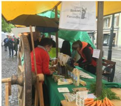
2 juin Marché bio de Bulle Bio-Markt in Bulle