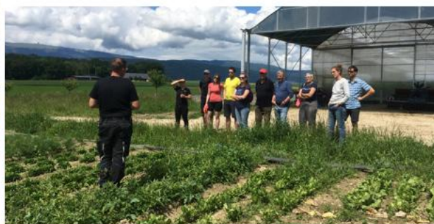
25.5.24 Notre Panier qui roule Unser Korb, der rollt