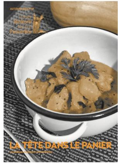
LA TÊTE DANS LE PANIER Un moment convivial lors d'un dîner de Noël.

Un beurre de noix et miel délicieux, parfait pour accompagner vos plats préférés.