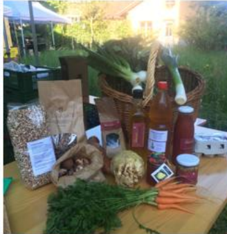
11 mai Marché du jardin botanique de Fribourg pour les plantons Markt des Botanischen Gartens Freiburg für Setzlinge